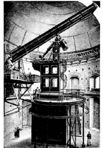
L'observatoire de Meudon (en 1898)

L'étude de cette planète a montré la présence de dioxyde de carbone dans l'atmosphère, ce qui rend possible une vie. La température de l'air est entre -10 et 40° Celsius. Les astronomes ont vu un signal lumineux non naturel sur cette planète. Est-ce la preuve qu'il existe une vie intelligente sur cette planète lointaine ?