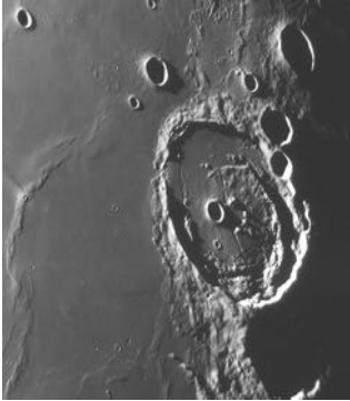
Des cratères à la surface de la Lune

Est-ce que tu as déjà visité un observatoire ? Un observatoire est un lieu où les astronomes observent l'Univers. Ils ont des télescopes. Ils étudient des étoiles qui se trouvent à d'énormes distances. Un observatoire est en général loin des grandes villes, là où la nuit est bien noire.